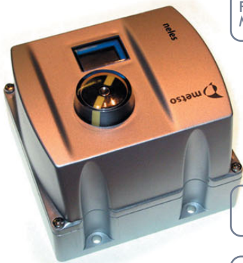
Venttiilin ohjain Metso Neles