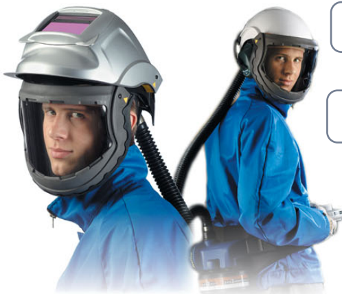
ProCap puhallinkypärä Scott Health & Safety Oy

“Tuotekehitystiimin viestintä paranee, kun muotoilijan osallistuu työhön visualisoimalla ryhmän ajatuksia” - asiakas