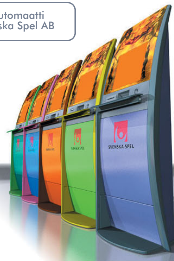
Peliautomaatti Svenska Spel AB