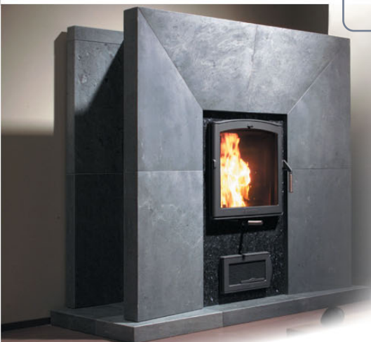
Fiamma-takka NunnaUuni Oy