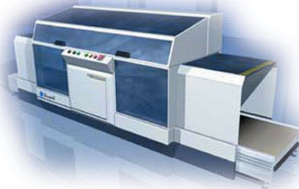
Vincent-robotti Pretech Oy